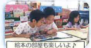
絵本の部屋も楽しいよ!