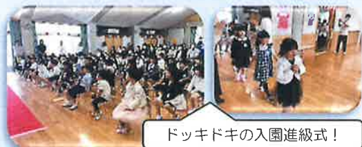
ドキドキの入園進級式!