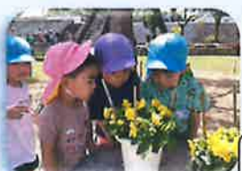
園庭は発見がいっぱい!