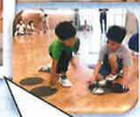
全員揃った始業式では クラス対抗オセロゲーム!