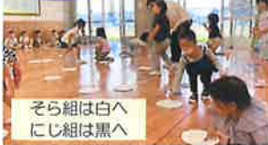
そら組は白へ にじ組は黒へ