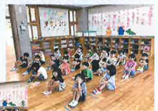
カッコ良く座ったり… 思いっきり楽しんだり