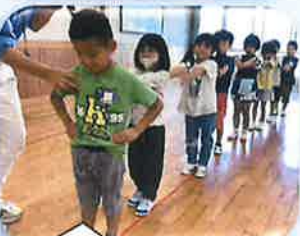
体操の前の日には並ぶ練習